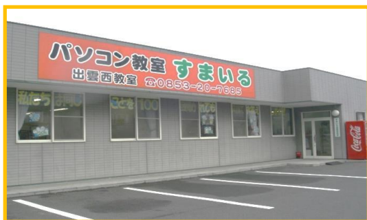
パソコン教室すまいる 外観